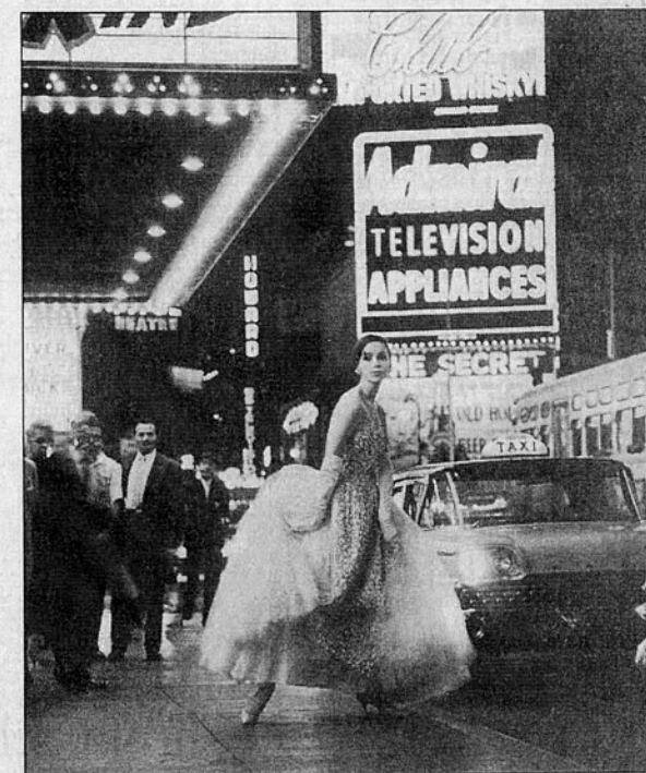
Broadway-Flair mit schönem Mädchen: Solche Fotos haben den Berliner Puhlmann berühmt gemacht