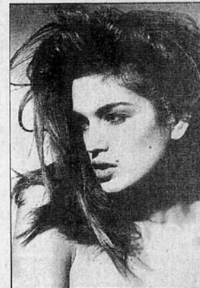
Auch sie steht gern vor Puhlmanns Kamera: Cindy Crawford

Puhlmanns Bilder sind schwarzweiß und im wesentlichen die stets inszenierten Motive Mode, Porträt und Akt. Intensiv arbeitet der Berliner gerade an einem Bildband: ein „autobiographischer Fotoablauf, bloß keine Memoiren. Ausruhen auf Lorbeeren ist das Verkehrteste. Dann ist es vorbei.“